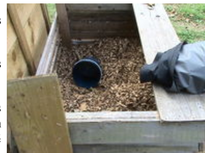
Compostage de feuilles mortes

Toutefois, le succès de ces bennes est aujourd'hui problématique puisque les tonnages augmentent vivement, entraînant de ce fait des coûts très importants (presque 100 000 € en 2008 !). Outre des produits verts, du terreau, des gravats ou encore du plastique ont été retrouvés dans ces bennes ce qui est formellement interdit.